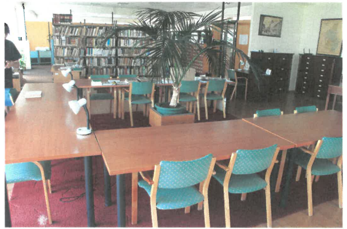
Fotók a berendezés utáni állapotról