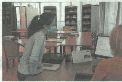
A helyismereti gyűjteményben

A II. Rákóczi Ferenc Megyei és Városi Könyvtár a teljesség igényével gyűjti az állományába illő dokumentumokat, melyek a megye és Miskolc, a történelmi vármegyék természeti adottságára, gazdasági és társadalmi viszonyaira, történetére, hagyományaira, kulturális életére vonatkoznak. Megtalálhatók itt a megyében élő, innen elszármazott, de a kapcsolatot megtartó, ide kötődő írók, költők kötetei is.