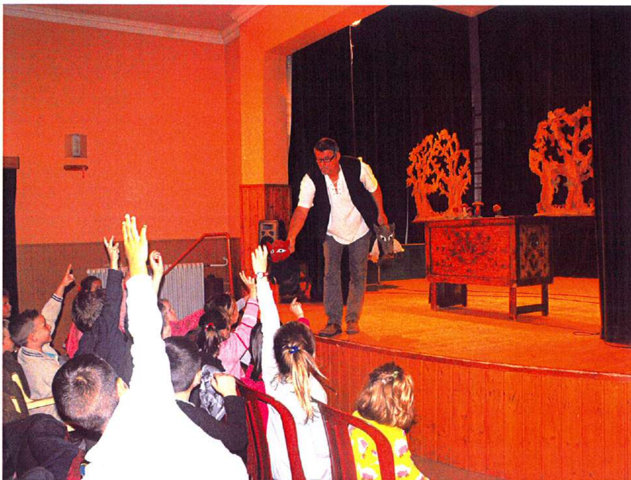
a Kalamajka Bábszínház Encsen