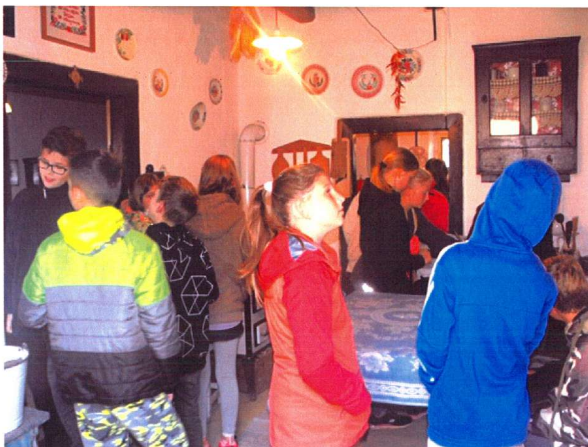
Látogatás az abaujvecseri Tájházban