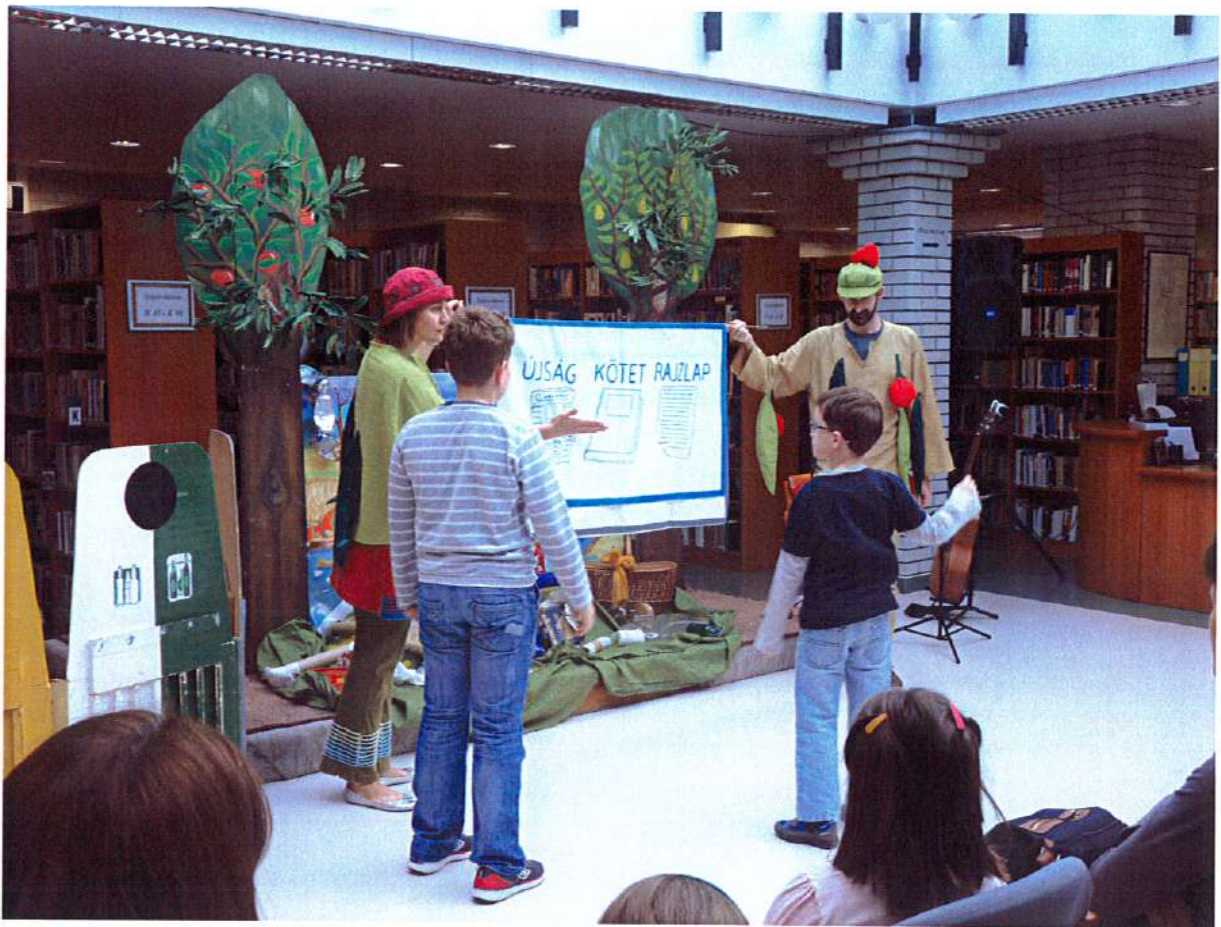
Lim Lom mesék Tiszaújvárosban