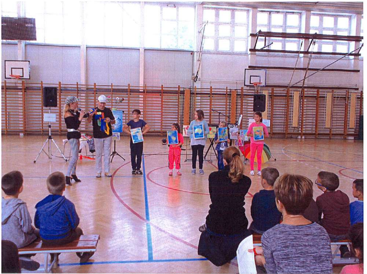
Környezetvédelemről játékos formában Mezőkeresztesen