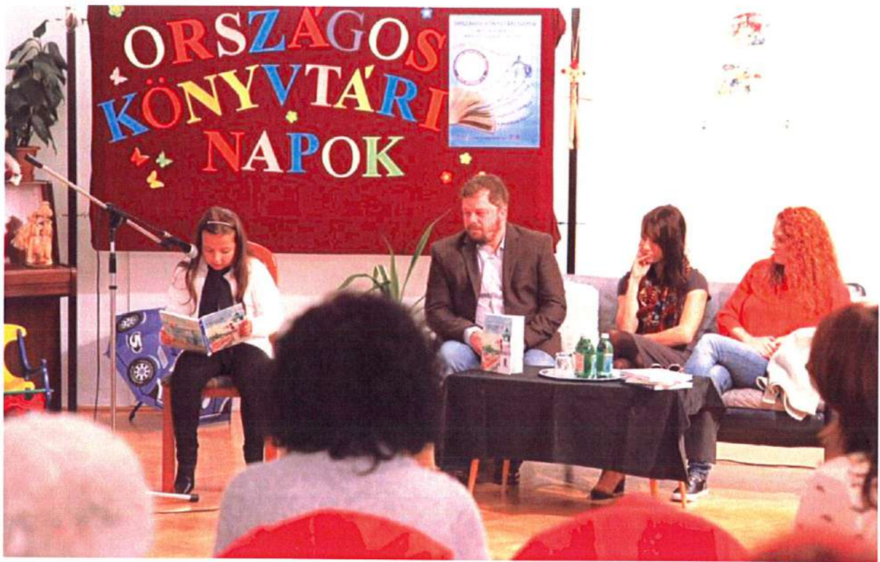
Milli és Rémi kalandjai Felsőzsolcán