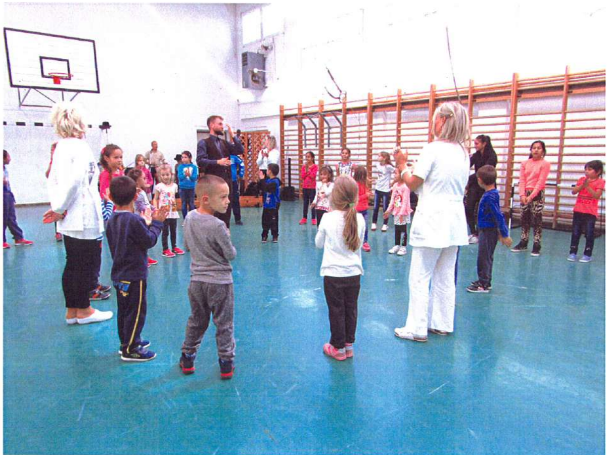
Ismerkedés a magyar zenei örökséggel Taktaszadán