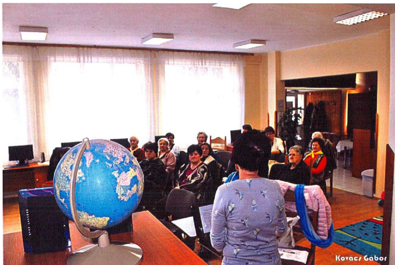
Egészségmegőrző előadás Cigándon