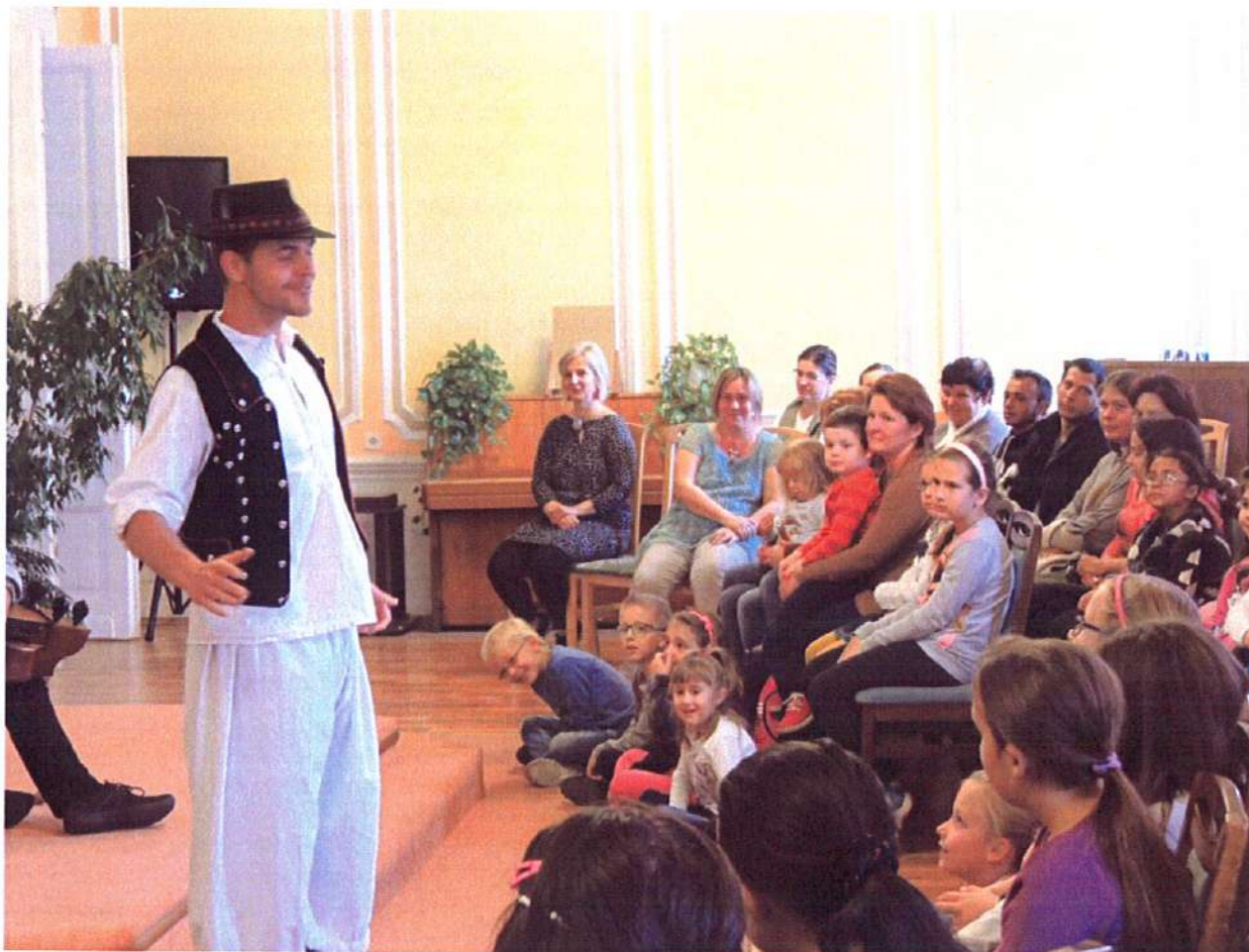
a Kerek Perc Egylet előadása Ózdon