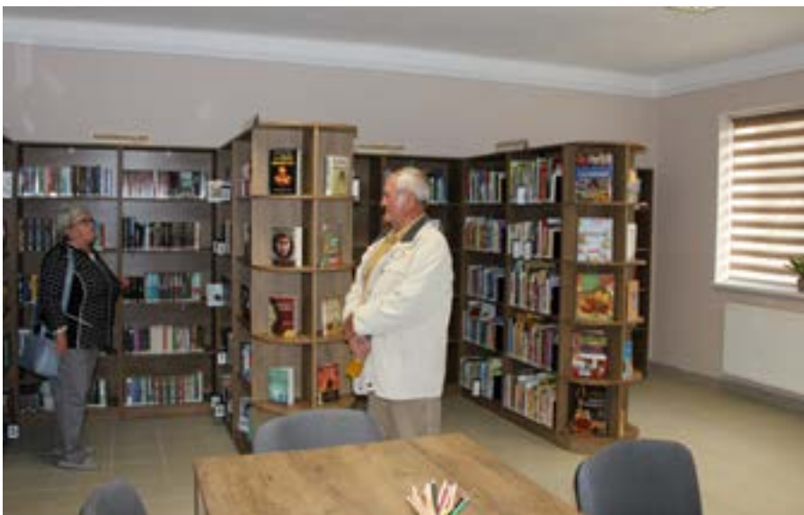
Megújult a tiszapalkonyai könyvtár olvasótere

A Tisza-parti településen már korábban megfogalmazódott az igény, hogy a helyi bibliotékát felújítsák. A tiszapalkonyaiak szeretik könyvtárukat, szomjaznak az olvasnivalókat, lelkes könyvtárhasználók. Az önkormányzat felújította az iskola szomszédságában álló épületet és – lehetőségeihez mérten – könyvespolcokat is vásárolt. Mivel a település csatlakozott a Könyvtárellátási Szolgáltató Rendszerhez (KSZR), a költségvetési törvény által garantált keretösszegeből teljes egészében megújulhatott a könyvtár bútorzata, a belső környezetet is sikerült sokkal otthonosabbá, komfortosabbá varázsolni. A könyvtári állomány elrendezésében és a 21. század igényeinek megfelelő közösségi tér kialakításában a II. Rákóczi Ferenc Megyei és Városi Könyvtár munkatársai nyújtottak segítő kezet a helyi könyvtárosnak.