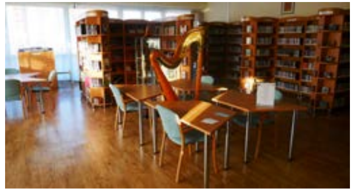
Zenemű- és médiatár

Könyvtárunkban 1974. október 1-jén, a zene világnapján nyílt meg a részleg, amely akkor a Zenemű- és hangtár nevet viselte, bútorzata napjainkig szolgálta a látogatókat. Az elmúlt mintegy 50 évben az állomány jelentősen gyarapodott, a polcrendszer pedig már-már kevésnek bizonyult. A régi, elhasznált, korszerűtlen polcokat és tárolószekrényeket sikerült modern berendezésre cserélni. Az egységes és rendezett környezet kialakítása érdekében egy korszerű lemezjátszóval és egy olvasói számítógépes munkaállomással is gyarapodott a részleg.