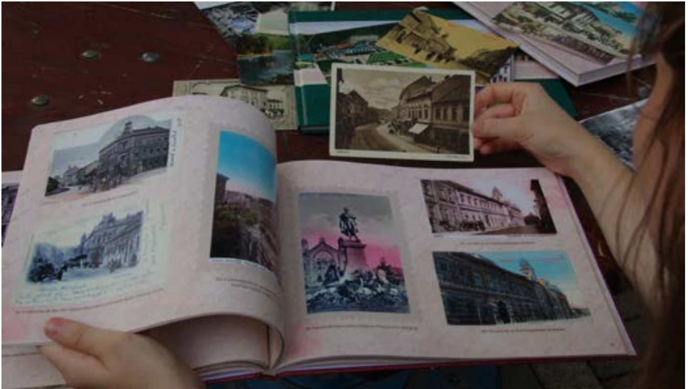
A kötetek megvásárolhatók a II. Rákóczi Ferenc Megyei és Városi Könyvtár központi épületében

A miskolci II. Rákóczi Ferenc Megyei és Városi Könyvtár apró- és kisnyomtatványai között különösen gazdag a helyi témájú képeslapok gyűjteménye. Ezek felhasználásával készült a Miskolc régi képeslapokon című sorozat három kötete.