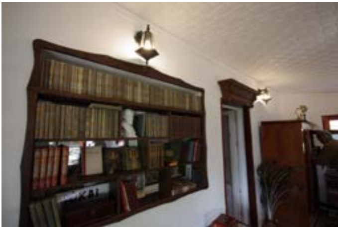
Könyvek és különleges relikviák az emlékszobában