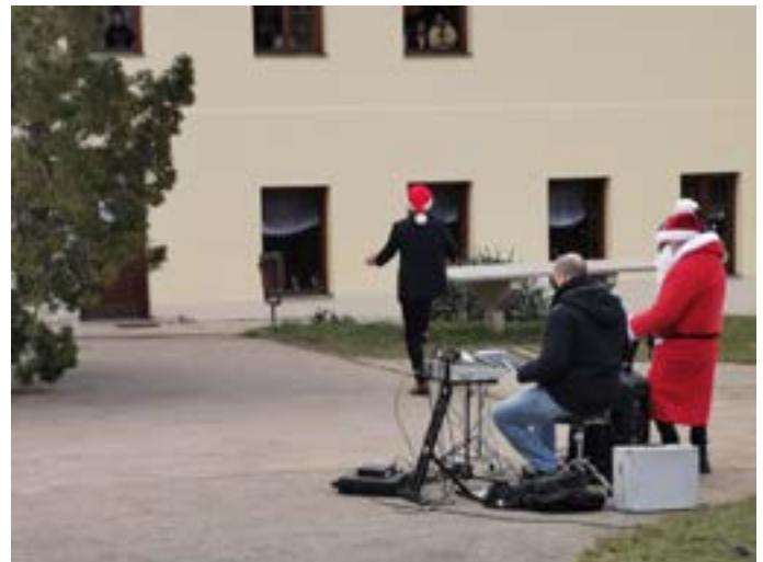
Ablakos koncert Hercegkúton