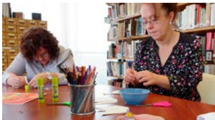
A szakmai napon kézműveskedtek is a gyermekkönyvtárosok

Reméljük, a „bagoly” nem felejtí az országnak ezt a részét, és a közeljövőben visszaszáll Borsod-Abaúj-Zemplén megye valamelyik könyvtárába.