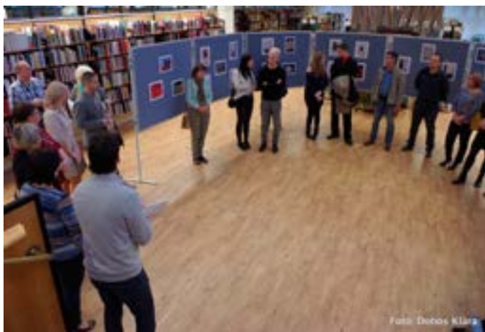
A fotópályázatra érkezett képekből rendezett kiállítás megnyitóján

„Múlt egy kattintásra” címmel 2019 őszén az emléktáblákhoz kapcsolódó fotópályázatot hirdetett a miskolci