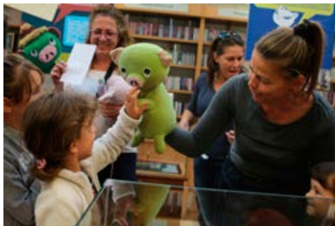
A miskolci Csodamalom Bábszínház a tiszaujvárosi könyvtárban vendégszerepelt