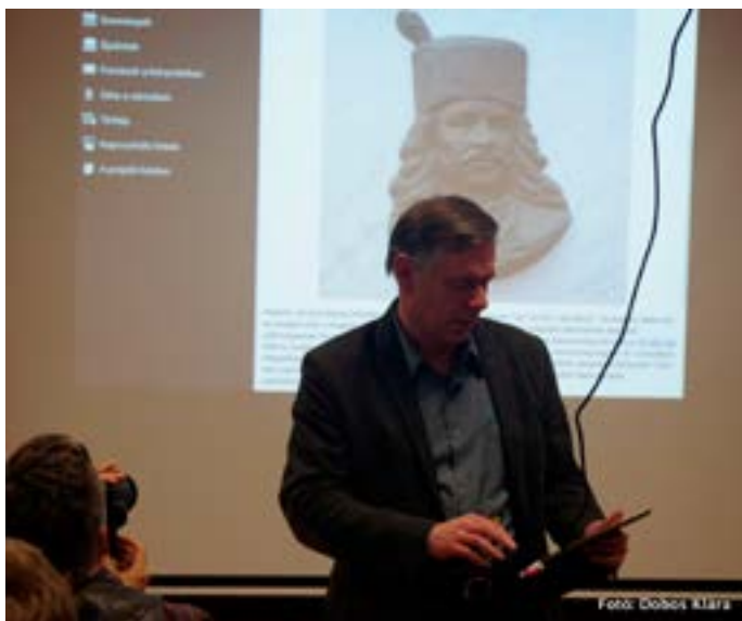
Véghe Norbert (Oron Kft., Lőcse) készítette az applikációt

jük fel. A „Virtuális séta” segítségével Kassa és Miskolc belvárosának néhány kiválasztott emléktáblája 3D-s verzióban is látható, így megismerheti az érdeklődő a táblák környezetét, az utcaképet is.